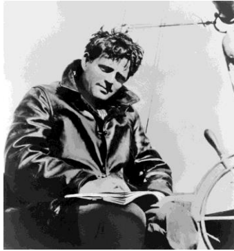
Jack London